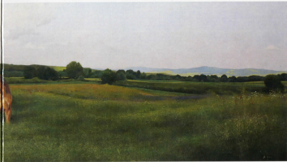
Сага из равнице, 2016, уље на платну, 70x250 cm