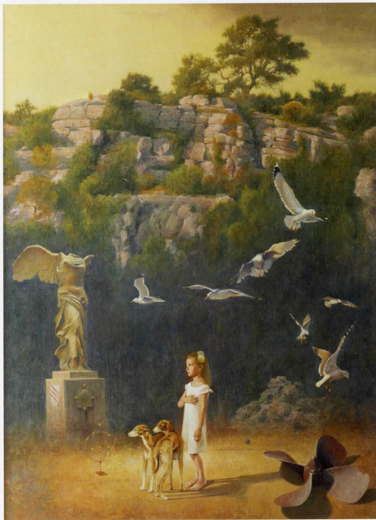
Чаролија ветра, 2016. уље на платну, 130x97 cm