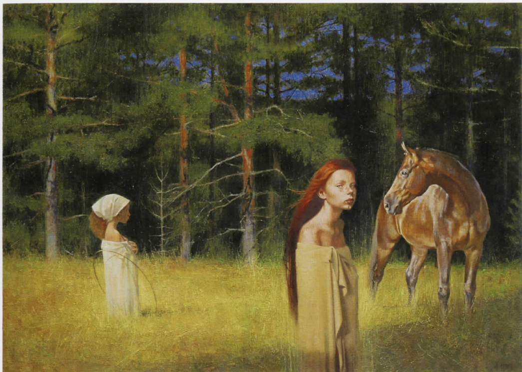
Anima mea, 2015. уље на платну, 50x70 cm