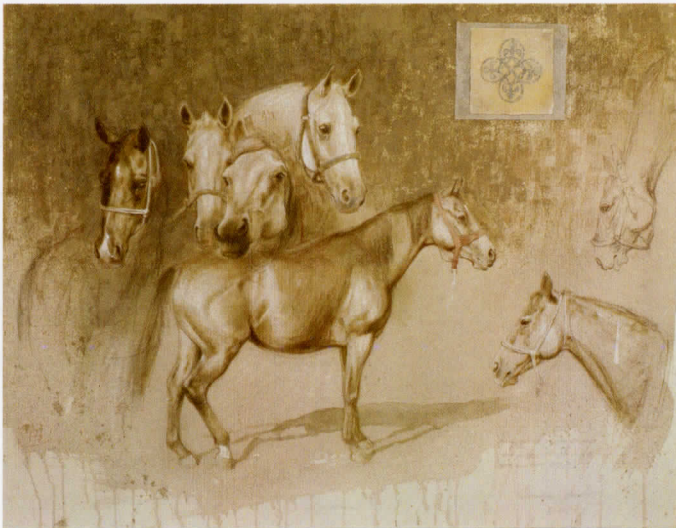
Сусретања, 2011. цртеж комбинована техника, 52 x 67cm